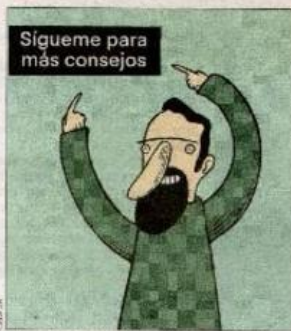
Así cerró su desahogo en modo ilustración.

-Terminas anulando sentimientos y emociones que son sumamente humanas y muy necesarias para crecer, como la duda, el miedo, el rencor, la culpa, la tristeza. Entonces (este tipo de frases) me parece que terminan siendo una deshumanización y la hacen un flaco favor a lo que justamente ellos están tratando de proponer que es "tienes que estar bien". Y a mi juicio, estar bien incluye no estar bien de vez en cuando.