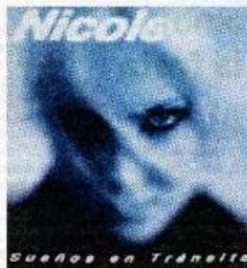
► Sueños en tránsito (1997), de Nicole