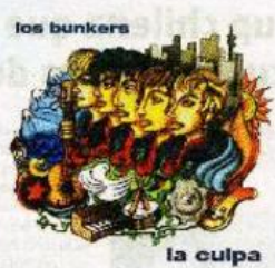
► Los Bunkers entre los discos del nuevo siglo.