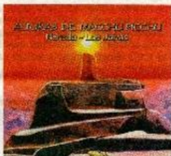
► Un clásico a cargo de Los Javalas.