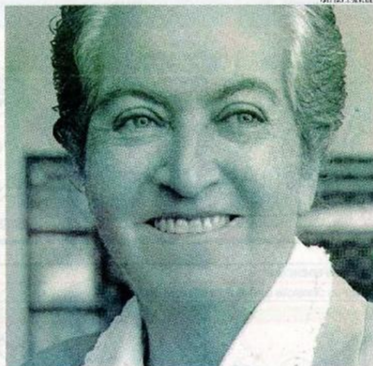
LA PUBLICACIÓN CONTIENE TEXTOS QUE CORRESPONDEN A LA POESÍA PÓSTUMA DE LA PREMIO NOBEL.

Sobre estas obras, la ministra de las Culturas, Consuelo Valdés, destacó que "Poema de Chile" es una creación donde están plas-