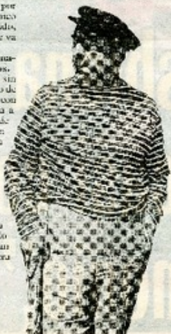
La imaginación de Neruda tenía sus raíces en lo material y no en las fantasías, asegura Uribe.

escrito una sola línea de verso. De todos modos, se trataba de un hombre de una inteligencia, de una imaginación que tenía sus raíces en lo material, no en las fantasías. Era un muy buen observador de la realidad del país y de otras partes del mundo. Era un hombre muy leído, muy cultivado. En realidad, se trataba de un hombre de la más alta categoría que puede dar un país como el nuestro", apunta sin un solo respiro.