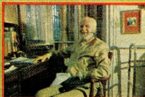
Arturo Aldunate Phillips, un hombre que encadena el equilibrio entre el humanismo y las matemáticas.

En 1971 se trasladó a enseñar en la Universidad de Chile, un hombre que encontraba el equilibrio entre el humanismo y las matemáticas. Un hombre que llegaba a ser amigo, con iguales posibilidades de entendimiento, de Neruda y Wiesner von Reuter, los hombres en Arturo Aldunate Phillips.