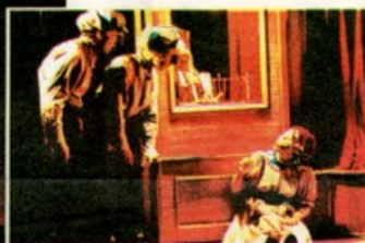
"Gemelos" se presenta de martes a domingo en el nuevo Teatro del Parque.