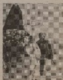
►► Una de las acuarelas que se exhibirán en el Centro Mori.