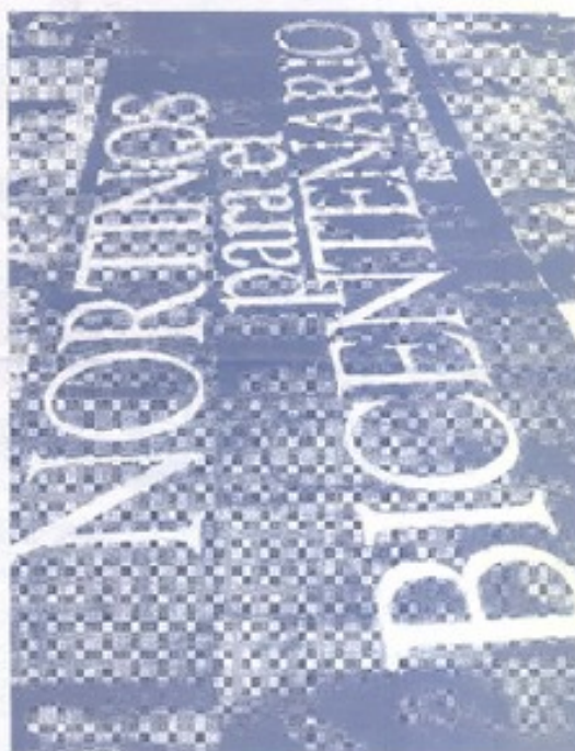
El libro fue lanzado ayer en la Casa de la Cultura.