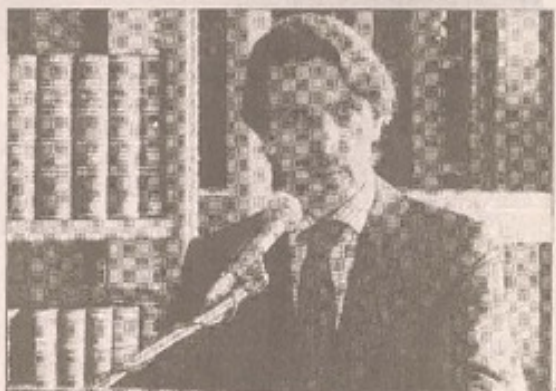
SIN PELOS EN LA LENGUA.— En su libro, José María Aznar revela episodios con distintas personalidades y no se reserva su comentario sobre ellos.

En este particular recuento de reuniones, entrevistas y diálogos, Aznar también deja espacio para dar su singular visión sobre