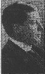
En 1900 fue secretario de redacción de El Mercurio ; más años después escribió su directorio. Al tiempo volvió en su política editorial, hasta que fundó junto con amigos de Alessandri en 1902.

En momentos que marchó la revista El Ferrocarril sobre El Financiero , un periódico escolar que con versos e ilustraciones contrastó a otros que desmor-