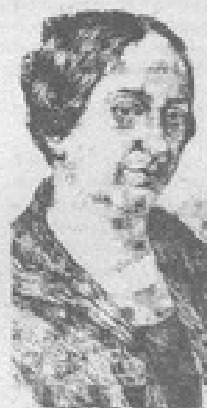
MERCEDES MARÍN DEL SOLAR. Retrato a Ulpia, c.1846.

Falleció esta dama en 1867 y ha sido considerada como la primera poetisa chilena que publicó sus poemas. La ciudad de La