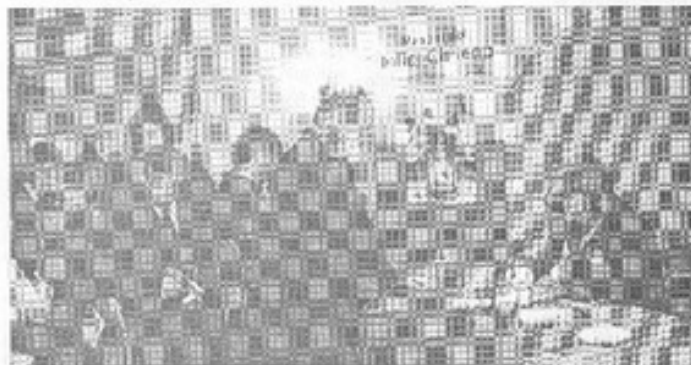
El autor, detallando su libro a numerosos compradores.

dado que su temática tiene una gran actualidad. Señaló además que la calidad profesional de los autores avala la calidad del libro y que, sin lugar a dudas este tendrá una muy buena acogida por el público lector. Señaló además su satisfacción por el hecho de que el lanzamiento del libro se hubiese efectuado en los salones de la Sociedad de Escritores, por cuanto a ésta le