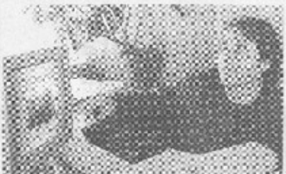
Sequedra explicó que los paneles de acero inoxidable perforado se transformarán en el soporte de los poemas "Oración para que no me olviden", "Poema de la Tierra",