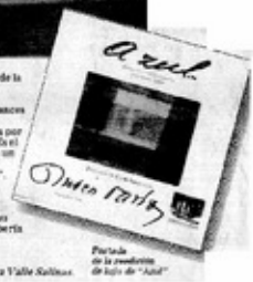
Portada de la reedición de la obra "Azul" de Rubén Darío.

Este libro es una obra que debe ser seguida de los libros que se editaron en Valparaíso y en la ciudad de Valparaíso.