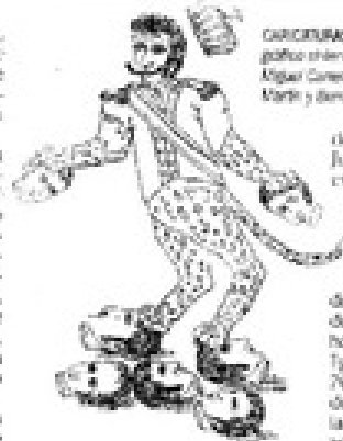
CARICATURAS SATÍRICAS. En la época del humor gráfico chilo destacan esos dibujos de José Miguel Carrera desde su fuga del exilio de San Martín y Bernardo O'Higgins.

La segunda caricatura de Carrera muestra a San Martín con aspecto