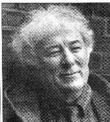
Los críticos lo señalan como "el poeta irlandés más importante desde Yeats".