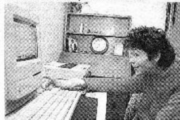
EN SU COMPUTADOR prepara un libro de poemas, que espera editar algún día.