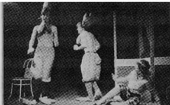
Una escena del reidero cuadro sobre la madre posesiva y la familia algo "loca".