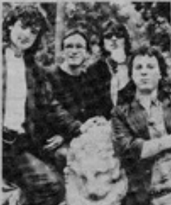
Vuelven los "accidentados" rockeros argentinos.

Con la presencia de los Enanitos Verdes como invitados estelares, se realizará la versión 1989 del Festival Alcántara, tradicional-