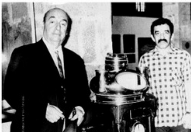
Con Neruda en La Maaque en Francia, en 1972. Gabo acompañó al poeta en París a comprarse una chaqueta de tweed que le encantaba. La encontró después en su casa en Isla Negra.