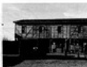
Pabellón del Campamento del Chiflón del Diablo.