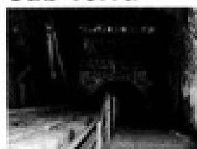
Acceso al Chiflón del Diablo.