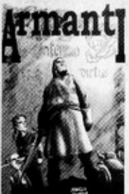
La historia panadora de Puro 2000 ya está disponible.