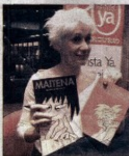
Los trabajos de Maitena se publican en 17 países.

-No. Sólo hago los guiones. No. Yo soy el que lee los guiones. Y cuando me parecen malos se lo digo.