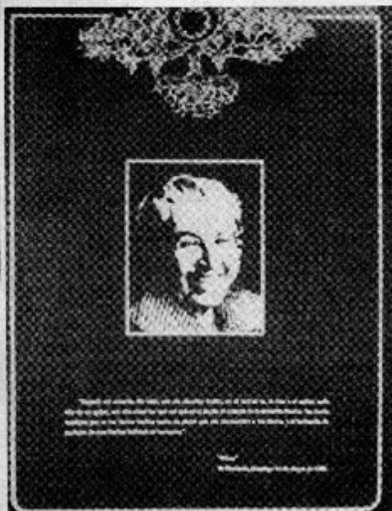
Una interesante exposición sobre "Poemas a la naturaleza en nuestros Premios Nobel" se encuentra abierta al público en el salón del Edificio de las Organizaciones Civiles.

La exposición permanecerá abierta hasta el viernes 21 de este mes.