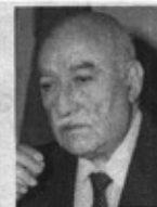
Por Tito Castillo

Era un conocedor profundo de la literatura francesa. Lector constante de Renan, de