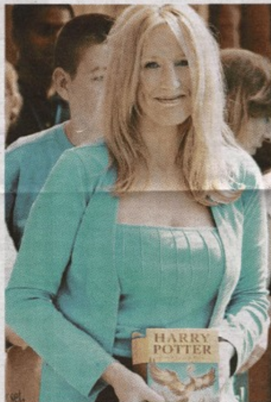
ADVERTENCIA La escritora J.K. Rowling prometió que no escribirá en el futuro precuelas o libros basados en tiempos anteriores a los de la saga de Harry Potter.

“En el sexto libro, el mundo mágico está en guerra y Harry tendrá que dominar sus propios sentimientos para volverlos útiles”.