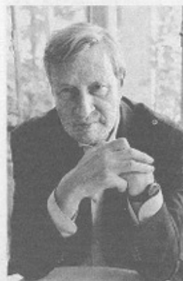
GIANNI VATTIMO es filósofo y miembro del Parlamento Europeo.

El filósofo italiano Gianni Vattimo, miembro del Parlamento Europeo y formulador del llamado "pensamiento débil", será el encargado de cerrar el segundo ciclo de conferencias sobre humanidades organizado por la Presidencia, el lunes 3 de noviembre, programa que este año contó con la participa-