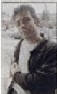
Arturo Rossel, director peruano, en una escena de su obra "El teatro".

En su obra "El teatro", Rossel busca un lenguaje escénico que sea atractivo y nuevo. Su obra es una muestra de su lenguaje escénico, que busca ser atractivo y nuevo.