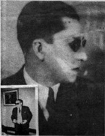
■ Su vocación de escribir comenzó cuando era alumno del Instituto Nacional, y duró hasta sus últimos días.