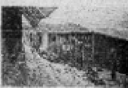
AL PIANO DE DON RAMON CARNICER

En la vida de Fernando Díaz, el poeta que hizo reír al siglo, hay un momento que merece ser recordado. Fue el día en que, después de haber escrito una de sus obras más conocidas, se encontró con un grupo de amigos y les leyó una de sus últimas composiciones. Los amigos se rieron mucho y él se puso a reír también. Fue un momento de alegría y de fraternidad que se ha convertido en una de las imágenes más queridas de su vida.