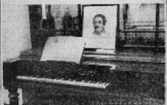
EL PIANO DE DON RAMON CARNICER