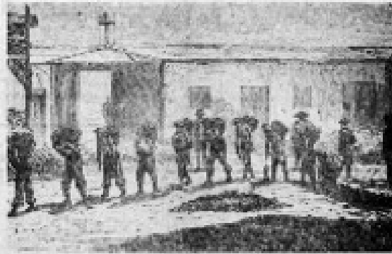
AL PIANO DE DON RAMON CARNICER

En la vida de Fernando Díaz, el poeta que hizo reír al siglo, hay un momento que merece ser recordado. Fue el día en que, después de haber escrito una de sus obras más conocidas, se encontró con un grupo de amigos y les leyó una de sus últimas composiciones. Los amigos se rieron mucho y él se puso a reír también. Fue un momento de alegría y de fraternidad que se ha convertido en una de las imágenes más queridas de su vida.