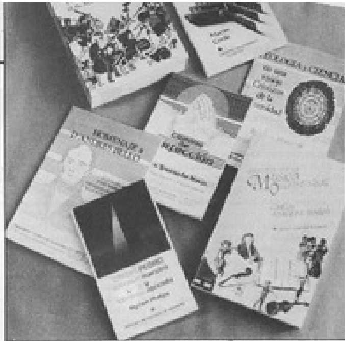
Títulos recientes de Ediciones Universitarias, entre los que figura "Pedro, maestro y aprendiz".

El próximo libro de la autora que publicará Ediciones Universitarias, se titula "Designios", es un segundo volumen de cuentos que fue galardonado con el Premio "Pedro de Oña", de la Casa de la Cultura de la Municipalidad de Nuble. Ha entre-