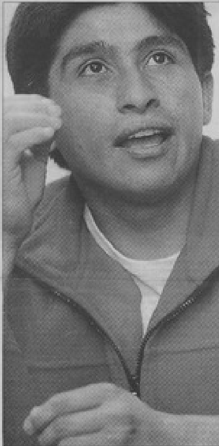
CLAUDIO Y LOS ANGELES.—"Mi intención es reflejar la imagen de los ángeles, confundidos a lo largo de la historia con seres extraterrestres".

Este período pertenece a la presentación del libro "Irenko y la