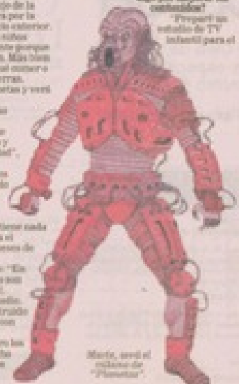
María, será el villano de "Planetas".

Es una historia de independencia que ha tenido costos, pero también restricciones. Especialmente en sus últimos montajes, los más inquietos de su compañía y de la historia del teatro infantil local. • El libro de la tierra. Costo: $14 millones. Espectadores: 120.000. • El concierto de los pájaros. Costo: $6 millones. Espectadores: 80.000. • Planetas. Costo: $4 millones.