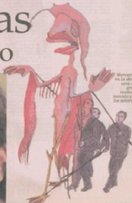
Moaillán en la obra, será un gran momento vivido por los actores.

—¿Muchas veces me he hecho esa pregunta. Y creo que trabajo con los niños por su honestidad. Siento que los niños se sienten obligados a cumplir con el teatro, van a ver una obra y se obligan a encontrarla buena. Los niños no tienen prejuicios. Te miran a la cara y te dicen: me gustaría me gustó. Eso es algo impagable y que viene desde el teatro. La televisión y el pueblo están en salvo de esa honestidad, porque los niños, cuando algo te les gusta, lo dejan prendido y se van a jugar.