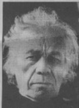
Para efectos de la producción de este ciclo se creó Antiparra Productions, "organización con fines de lucro", según afirma el propio escritor.