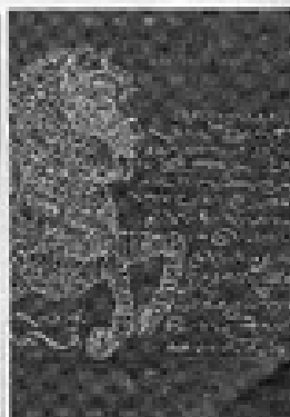
Portada del nuevo libro.

que tiene lugar en el período de los documentos señalados. "El estilo no es el hombre, sino el tiempo", dice Morales, para concluir que los textos, apreciados con ese criterio, se convierten en