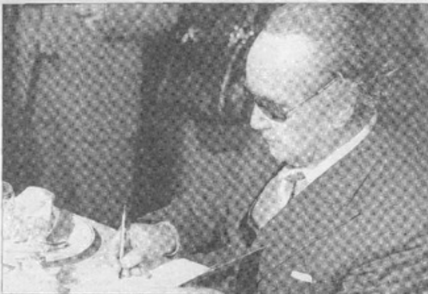
El escritor Enrique Lafourcade presentó su libro sobre la relación del premio Nobel y la sobrina de Matilde Urrutia.