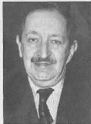
Eduardo Anguita, Premio Nacional de Literatura 1988.