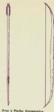
Arco y Flecha Atacameños