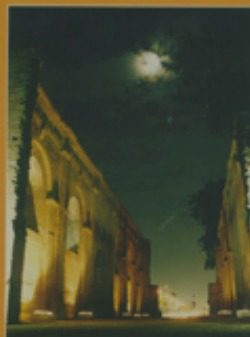
Monumento Histórico Muras de la antigua Iglesia de Mapocho Región Metropolitana, Comuna de Mapocho