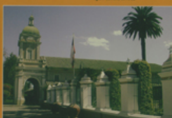
Monumento Histórico Hacienda San José del Carmen El Pangu 14ª región, Comuna de Panguel