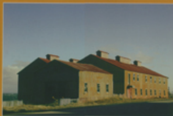
Ermita Santa Ana de San Gregorio 10ª región, Comuna de San Gregorio