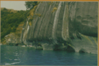
Santuario de la Virgen María Capilla de Mirena 10ª región, Comuna de Valdivia