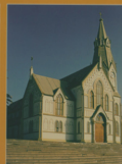
Monumento Histórico Catedral San Marcos de Aique 12ª región, Comuna de Aique