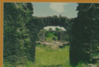
Monumento Histórico Capilla de San Pedro de Alcántara de Mirena 10ª región, Comuna de Corral