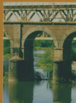
Monumento Histórico Puente sobre el Río Pangu 12ª región, Comuna de Pichón