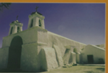
Monumento Histórico Iglesia de San Francisco de Chilo-Chilo 13ª región, Comuna de Colbuén