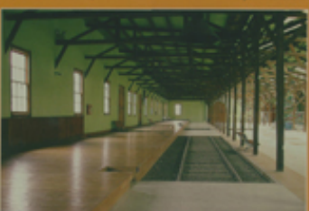
Monumento Histórico Estación de Ferrocarriles de Colbuén 13ª región, Comuna de Colbuén