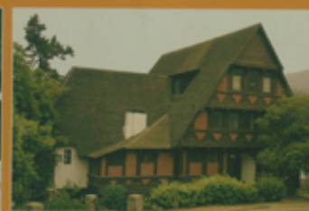
Monumento Histórico Casa Adlonstein 9ª región, Comuna de Esquel