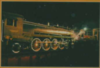
Monumento Histórico Locomotora M1, Tipo 80 de 1922, Casa de Máquinas de Temuco 7ª región, Comuna de Temuco