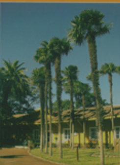
Monumento Histórico Casa Patrocinio y Parque del Fondo Peñalón 11ª región, Comuna de Valdivia