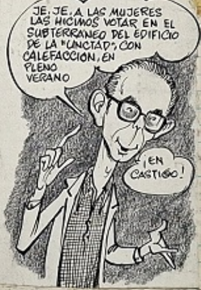
Carlos Altamirano Jefe del Partido socialista que obtuvo una baja votación femenina en el distrito de Santiago.