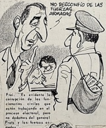
Frei. "Es evidente la corrupción de los funcionarios civiles que están trabajando en el proceso electoral, pero no dudamos del general Prats y las fuerzas armadas."