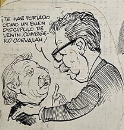
Corvalán. El 18,89 de abstenciones fue por parte de ellos, pues trasladamos a los funcionarios contrarrevolucionarios a otro lugar y quitamos la movilización en los sectores mermos para que no fueran a votar.