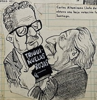
Corvalán. —Usted dijo, compañero Presidente que se conformaría con el 30% de la votación, pero gracias a este librito así llegamos al 44%.