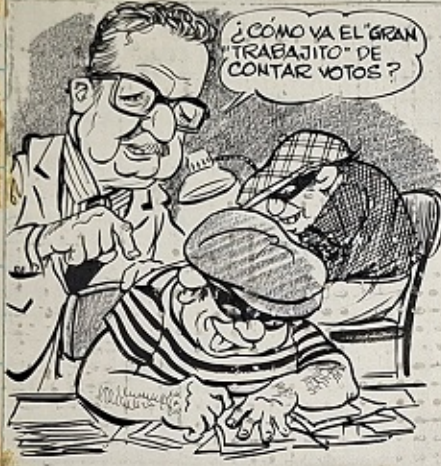
RECUNTO DE VOTOS EN EL MINISTERIO DEL INTERIOR.