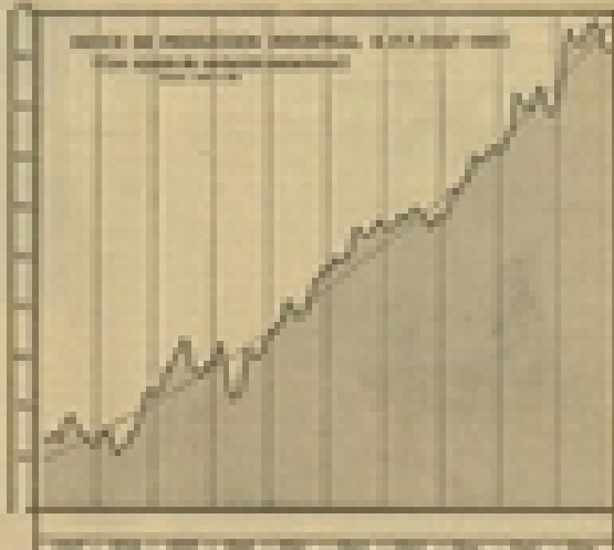
GRÁFICO N.º 1

En el tercer período, la producción industrial continuó creciendo, pero con una mayor volatilidad que en los períodos anteriores.