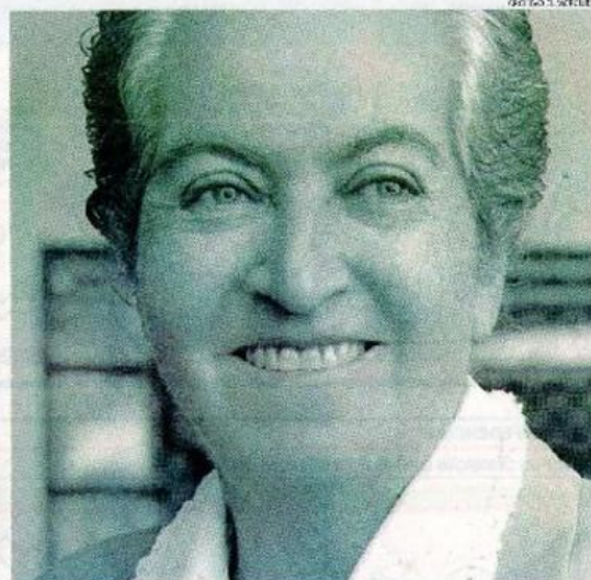
LA PUBLICACIÓN CONTIENE TEXTOS QUE CORRESPONDEN A LA POESÍA PÓSTUMA DE LA PREMIO NOBEL.

Sobre estas obras, la ministra de las Culturas, Consuelo Valdés, destacó que "Poema de Chile" es una creación donde están plas-