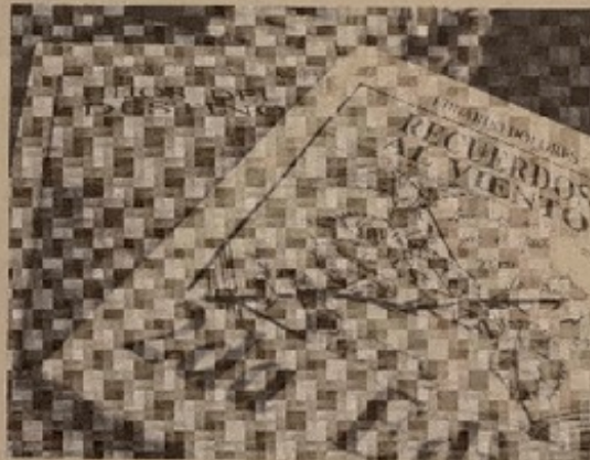
DOS LIBROS editados a la fecha tiene el poeta, dieciséis están inéditos.

Es un escritor con grandes historias inferiores que contar. Su poemario 'Hijos del destino', fue lanzado hace algunos días en Quirihue.