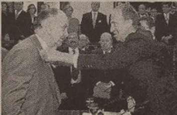
El momento en que el autor gallego recibe el premio "Miguel de Cervantes" de manos del Rey Juan Carlos, en 1996.