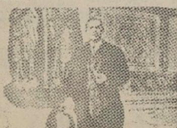
Huidobro en París, donde encontró fuentes de inspiración y pasión.

Una hoja cae algo pesa volando, cuando miran los ojos creado sea.