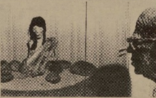
LA MISS CHILE, tituló el año pasado el Padre Le Paige considerando su belleza y su excelente estado de conservación. La misma permanece en una de las vitrinas centrales del museo arqueológico que lleva su nombre situado uno de los principales atractivos de los visitantes.

Pensando en el estudio analítico que requiere las piezas arqueológicas postuló tres maneras para presentar trabajos científicos: una sistemática, basada en estadísticas, otra de espíritu científico con descripciones metódicas que incluye todo el material crítico científico sin permitir dudar alguna y una tercera de mentalidad