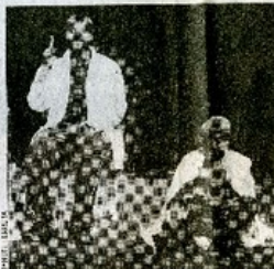
El emblemático director Peter Brook rebobó en los escenarios chilenos con dos años atrás. "Stgoe. a Mil" está marcado ya una de las piezas que trajo uno de los grandes del teatro mundial.