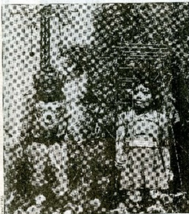
"La pequeña gigante" es la responsable del hito más masivo del festival. En sus dos vistas de 2007 y 2010, reunió a unos 3 millones de espectadores en total.