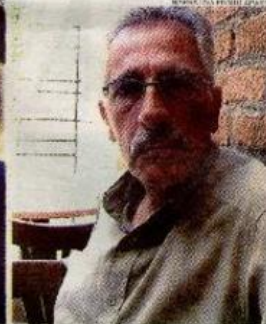
EL PERIODISTA QUE SIGUIÓ EL CASO PSICÓFARAS.