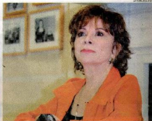
LA PREMIÓ NACIONAL DE LITERATURA 2012, ISABEL ALLENDE.

La historia se sitúa en San Francisco, en el año 2010 y su protagonista es Alma Belasco, una mujer octogenaria que ha decidido dejarse a la gente