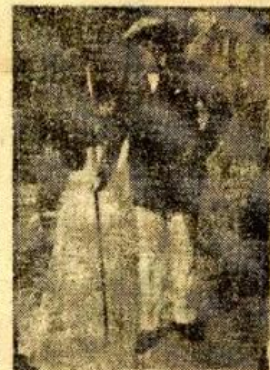
Matías Errázuriz. Diplomático, embajador, hombre de mundo.