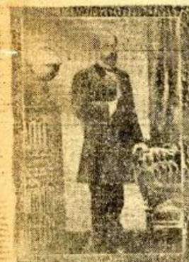
Federico Errázuriz Zañartu. Uno de los presidentes Errázuriz.