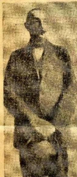
DON LADISLAO, el fogoso político de la década del veinte.

Resalta aún más interesante y valiosa esta reseña de la antigua obra de Medina, el conocimiento iconográfico de numerosas familias con figuras y grupos de esta familia, que sirven de modelos a comaradas similares, en