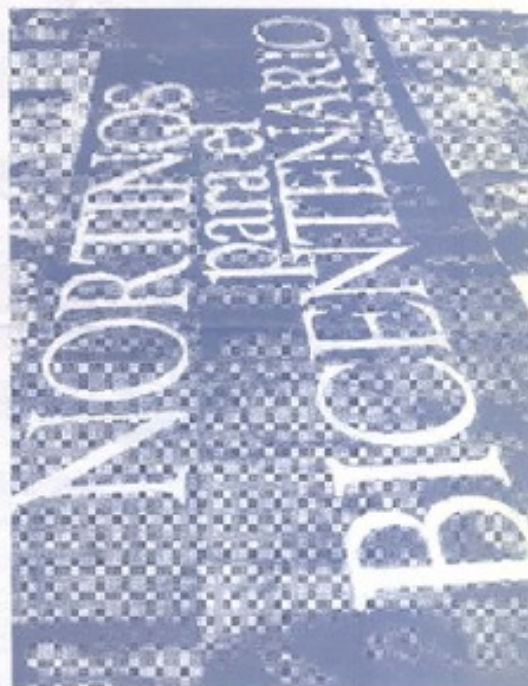
El libro fue lanzado ayer en la Casa de la Cultura.